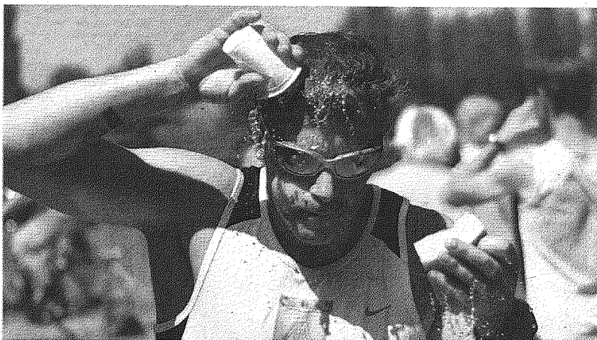
Water, water en water. Dat waren de drie behoeften voor de lopers in het hete Nootdorp.